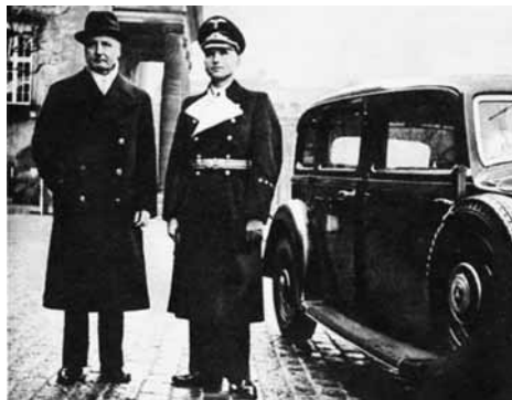
WERNER BEST (À DROITE), PLÉNIPOTENTIAIRE DU REICH AU DANEMARK, AVEC LE PREMIER MINISTRE DANOIS ERIK SCAVENIUS EN FÉVRIER 1943.

Bientôt, à Paris, surgissent pour Best des difficultés consécutives aux premiers attentats (août 1941) et à la répression qui s'ensuivit. Les militaires qui avaient compris que les fusillades massives d'otages qu'ils avaient appliquées jusque-là étaient contre-productives s'opposaient à Berlin et aux autorités policières du Reich qui se méfiaient de « l'administration de surveillance ». Les militaires n'oubliaient pas que Best était général de brigade SS et sa présence à Paris devenait gênante. Mais Heydrich se méfiait de Best qui avait été son second... Et l'installation à Paris, en 1942, de Oberg, commandant en chef de la police et de la SS (HSSPF), rendait désormais peu utile la présence de Best en France. Heydrich, qui l'avait écarté du RSHA, ne voulait pas de lui à Berlin. C'est sur le ministre des Affaires étrangères, Ribbentrop, que compte Best pour le tirer de sa position difficile. En vain ! Échec dû à l'intervention de Heydrich. Mais le 4 juin 1942,