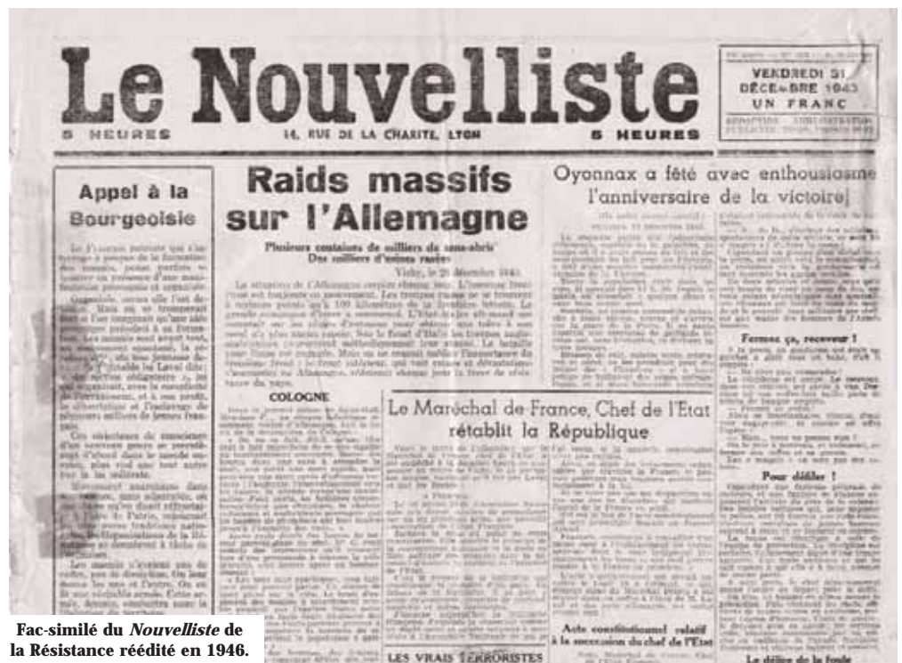
Fac-similé du Nouvelliste de la Résistance réédité en 1946.