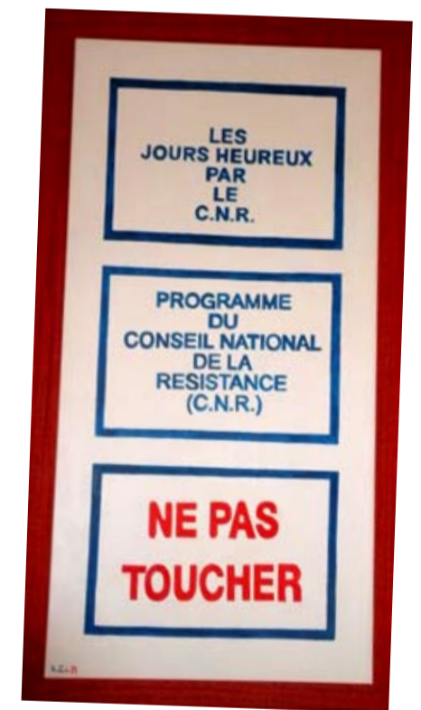
HUGO BERNARD, NE TOUCHONS PAS AU PROGRAMME DU CNR (HUILE SUR TOILE, 2011, 120X60 CM).