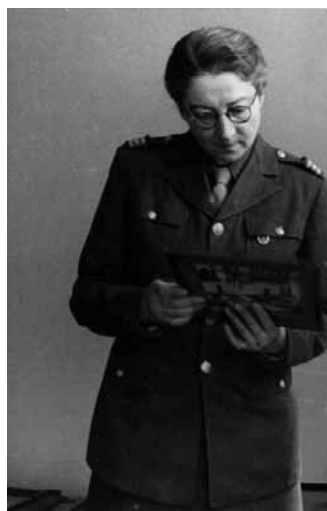
ROSE VALLAND, « CAPITAIN BEAUX-ARTS » À LA LIBÉRATION.

À la Libération, les œuvres cachées au début de la guerre quittent leurs châteaux pour réintégrer les musées. La Joconde est ramenée au Louvre « comme un trophée et comme une grande dame, dans la voiture même du conservateur », écrit Rose Valland dans son livre.