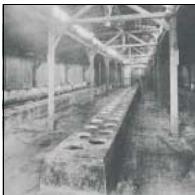
Des latrines au camp de Birkenau.

Des bâtiments « latrines » et des lavabos entrent en service en 1943. Leur conception est rudimentaire : de simples rigoles d'écoulement, recouvertes d'une plaque de béton avec une centaine de lunettes circulaires pour les latrines ou 90 robinets, dans le cas des lavabos.